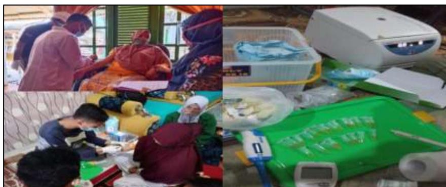
Gambar 2. Pemeriksaan kadar Hb dan Cholinesterase

Keracunan pestisida terjadi karena tubuh tidak terlindungi dengan baik. Biasanya terjadi pada saat pencampuran, mengaplikasikan, perawatan tanaman, dan penggunaan APD yang tidak lengkap. 14,15,17,19,20 Tingginya paparan pestisida juga akibat dari teknik penyemprotan yang kadang melawan arah angin, waktu penyemprotan pada siang hari, serta penggunaan pestisida secara “ cover blanket system ”, artinya pestisida tetap digunakan sebagai pencegahan, walaupun tidak ada hama. 6,14,17,25,26 Kelengkapan APD pada saat mengaplikasikan pestisida adalah baju lengan panjang, sarung tangan, masker, topi, sepatu boot. Namun banyak petani yang enggan menggunakan APD dengan alasan kenyamanan. Rendahnya penggunaan APD menunjukkan kurangnya