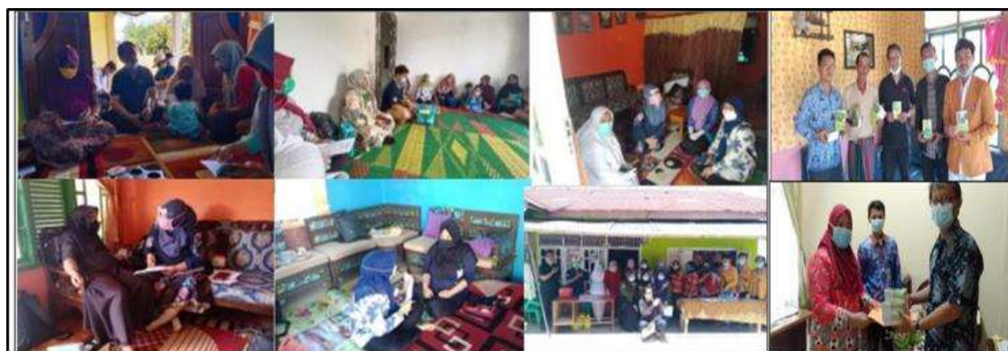
Gambar 2. Kegiatan Penyuluhan dan penyerahan buku saku

dan keberhasilan tahapan kegiatan. Hasil penilaian menunjukkan mayoritas peserta (90,0%) mengalami peningkatan pengetahuan. Hasil ini menyimpulkan bahwa metode penyuluhan dengan buku saku cukup efektif untuk peningkatan pengetahuan. Meningkatnya pengetahuan diharapkan dapat mengubah perilaku