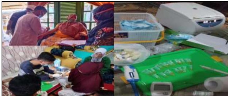
Gambar 2. Pemeriksaan kadar Hb dan Cholinesterase

Keracunan pestisida terjadi karena tubuh tidak terlindungi dengan baik. Biasanya terjadi pada saat pencampuran, mengaplikasikan, perawatan tanaman, dan penggunaan APD yang tidak lengkap. 14,15,17,19,20 Tingginya paparan pestisida juga akibat dari teknik penyemprotan yang kadang melawan arah angin, waktu penyemprotan pada siang hari, serta penggunaan pestisida secara “ cover blanket system ”, artinya pestisida tetap digunakan sebagai pencegahan, walaupun tidak ada hama. 6,14,17,25,26 Kelengkapan APD pada saat mengaplikasikan pestisida adalah baju lengan panjang, sarung tangan, masker, topi, sepatu boot. Namun banyak petani yang enggan menggunakan APD dengan alasan kenyamanan. Rendahnya penggunaan APD menunjukkan kurangnya