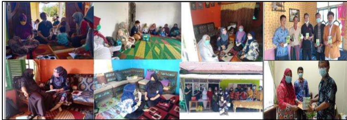
Gambar 2. Kegiatan Penyuluhan dan penyerahan buku saku

dan keberhasilan tahapan kegiatan. Hasil penilaian menunjukkan mayoritas peserta (90,0%) mengalami peningkatan pengetahuan. Hasil ini menyimpulkan bahwa metode penyuluhan dengan buku saku cukup efektif untuk peningkatan pengetahuan. Meningkatnya pengetahuan diharapkan dapat mengubah perilaku