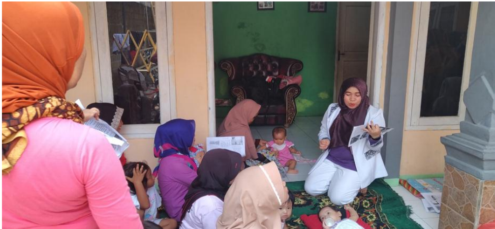
Gambar 2. Focus Group Discussion (FGD) Tentang Baby Spa dan Baby Massage