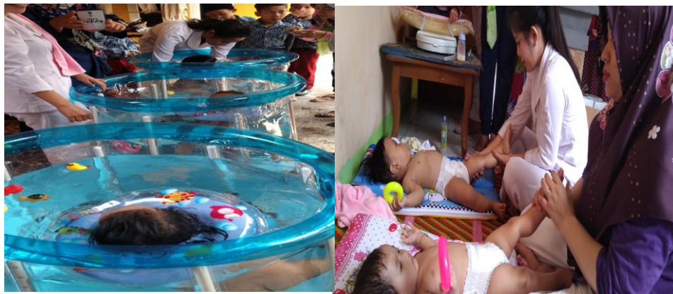
Gambar 3. Praktik Pijat dan Spa Bayi