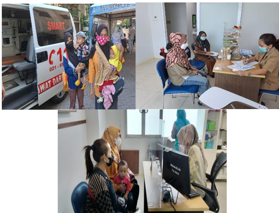
Gambar 2. Rujukan ke Rumah Sakit

penunjang seperti laboratorium dan radiologi sehingga jika ditemukan penyakit penyerta dapat ditatalaksana dengan cepat dan tepat.