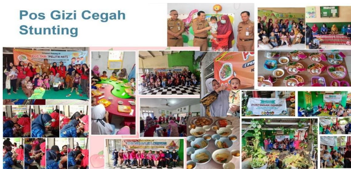
Gambar 4. Pos Gizi

perbaikan gizi dapat berjalan lebih sustainable .