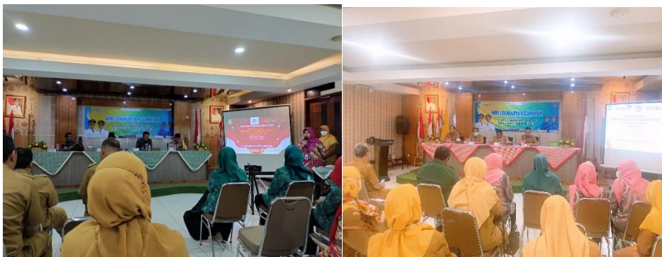
Gambar 7. Komitmen Bersama

Program Laksa Gurih ini diluncurkan sejak tahun 2018, Sebelum dilaksanakan inovasi Laksa Gurih, terdapat 162 orang balita yang mengalami gizi buruk berdasarkan