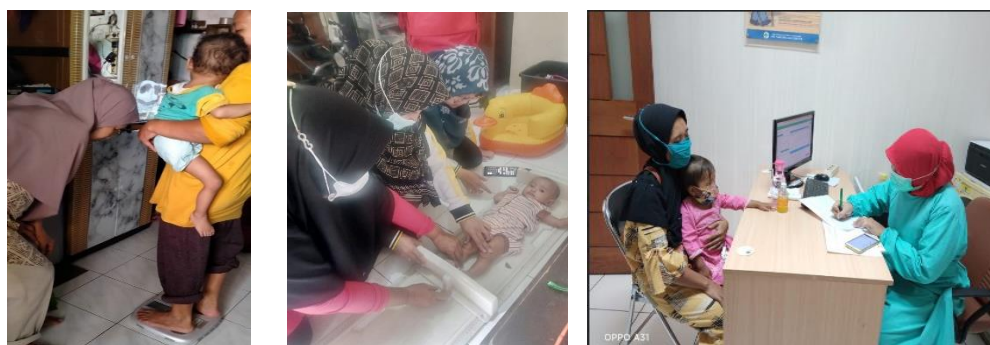
Gambar 1. Deteksi Dini Kasus

Rujukan ke Rumah Sakit dilakukan jika diperlukan pemeriksaan lebih lanjut oleh dokter spesialis anak, dokter gizi klinik serta pemeriksaan