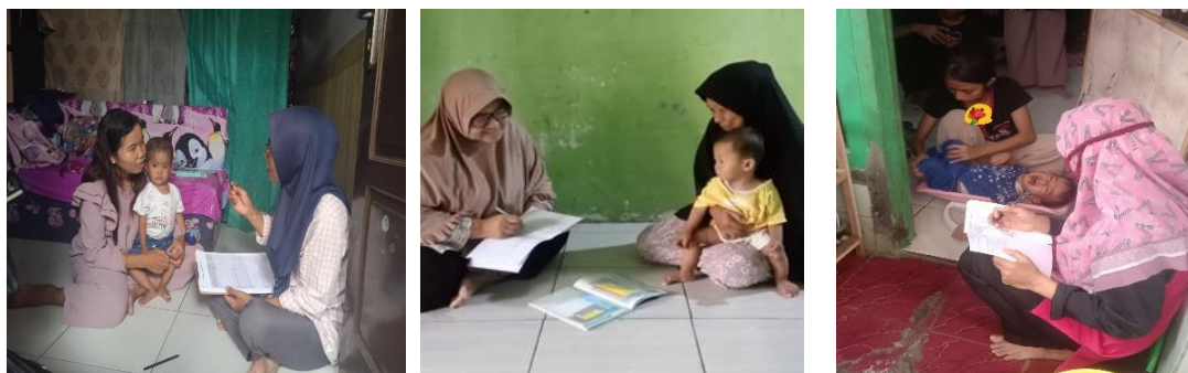
Gambar 3. Kunjungan Rumah

Pos Gizi merupakan wadah untuk peningkatan status gizi dan perubahan perilaku berbasis masyarakat sehingga