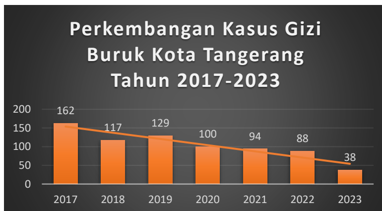
Grafik 1. Perkembangan Kasus Gizi Buruk

indeks berat badan menurut panjang badan atau tinggi badan (BB/PB atau BB/TB) di tahun 2017. Pada akhir tahun 2023, tersisa 38 balita yang masih mengalami gizi buruk.