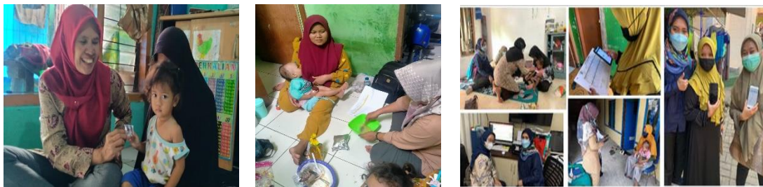
Gambar 5. Pendampingan Kader

Pencatatan pelaporan menggunakan format pendampingan Laksa Gurih secara manual dan elektronik, kader yang sudah mendapatkan pelatihan pengisian Laksa Gurih langsung mencatat kedalam aplikasi Laksa Gurih namun bagi kader yang belum dapat melaporkan kepada tenaga gizi